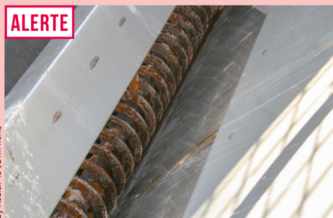
By Roulex 45 (Own work)

Le panel est en cours d'élaboration. Mais la tendance est claire : nous mobiliserons nos ressources sur des groupes limités d'entreprises, pour éviter l'éparpillement et obtenir des résultats tangibles.