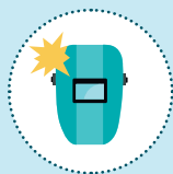
Fumées de soudage