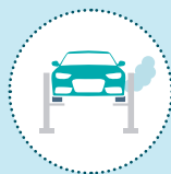
Émissions de moteur Diesel